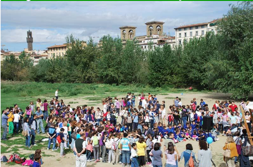
La premiazione delle classi fiorentine partecipanti al progetto "Arno, un fiume per amico"

ascoltate dai nonni e disegnato le specie di pesci e di volatili che popolano il fiume toscano. Le uscite al Parco delle Cascine, alla spiaggia dell'Arno e alla terrazza di Piazza Poggi, dove un tempo sorgeva l'antica "Fabbrica dell'Acqua", hanno permesso di osservare la realtà ambientale del fiume, anche nel tratto cittadino, in modo da poter comprendere la composizione del patrimonio faunistico e vegetale. Gli incontri lungo il fiume sono stati l'occasione per approfondire i temi legati alla biodiversità, alla difesa della qualità delle acque del fiume, alla connessione con il sistema urbano e ai mutamenti del fiume anche causati dall'azione del tempo e dall'agire dell'uomo. Questi momenti