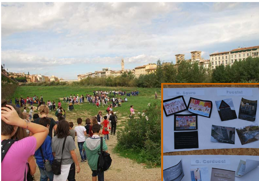
L'arrivo degli studenti alla spiaggia dell'Arno

Si è tenuta alla spiaggia dell'Arno, a Firenze, la premiazione degli studenti che hanno partecipato all'edizione 2012 del progetto "Arno, un fiume per amico". L'attività, iniziata la scorsa primavera e conclusa a fine settembre, ha riscosso l'interesse di un migliaio di ragazzi appartenenti a 50 classi, in rappresentanza di 25 scuole elementari e medie fiorentine. L'iniziativa ideata e proposta dall'Autorità di bacino dell'Arno rientra nell'ambito del progetto "Le Chiavi della città" organizzato dal Comune di Firenze. Gli studenti, aiutati dal personale dell'Autorità, hanno avviato un